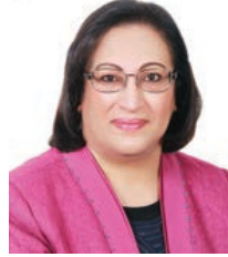
○ وزيرة الصحة.

وأشادت فائقة بنت سعيد الصالح بالجهود البارزة التي تبذلها اللجنة الوطنية لمكافحة نقص المناعة المكتسبة وشركة أديوكيشن بلاس واللجنة المنظمة للمؤتمر في الاستعداد المبكر لاحتضان المؤتمر، متمنية لجميع دوام التوفيق والنجاح.