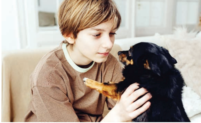
○ الكلاب سبب محتمل لالتهاب الغامض.

لدى الأطفال. من ضمن ٩٢ حالة في جميع أنحاء بريطانيا كانت ٦٤ حالة في الأطفال الذين كانوا من عائلات تملك كلابا أو تعرضوا للكلاب، وفقا لبيانات من وكالة الأمن الصحي في بريطانيا. ويستكشف خبراء الصحة الآن هذا الرابط، مما يعني أن انتشار التهاب الكبد بين الأطفال قد يكون بسبب المستويات العالية من ملكية الكلاب في البلاد. كما وجد أن ثلاثة أرباع المصابين، ذكروا استخدام عقار «الباراسيتامول»، بينما لم يتم الإبلاغ عن استخدام «الأسبرين».